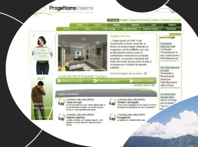
L'homepage di progettiamoinsieme.it