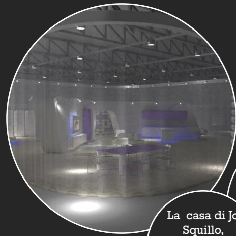
La casa di Jo Squillo, progettata da Simone Micheli