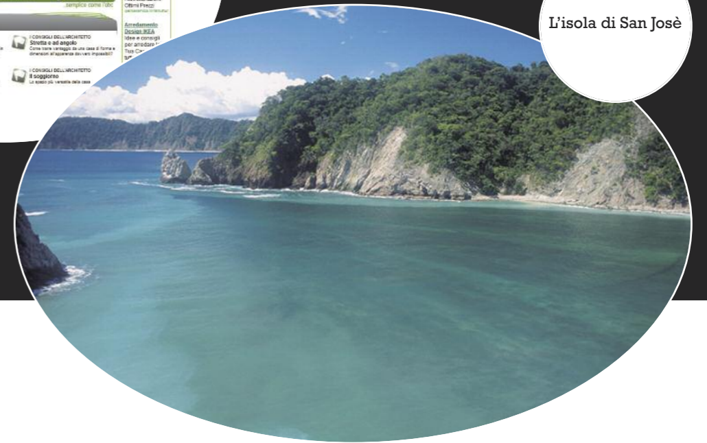
L'isola di San José